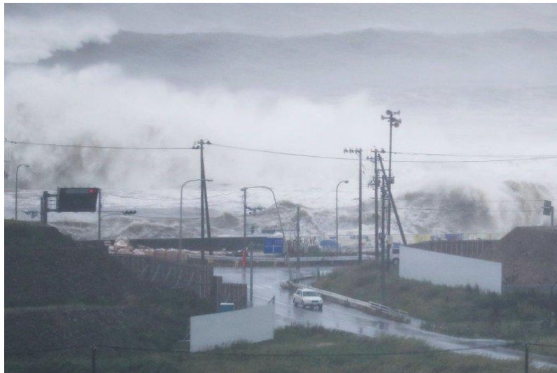
圖 2-第 10 號颱風在日本東北地區的海岸造成巨浪