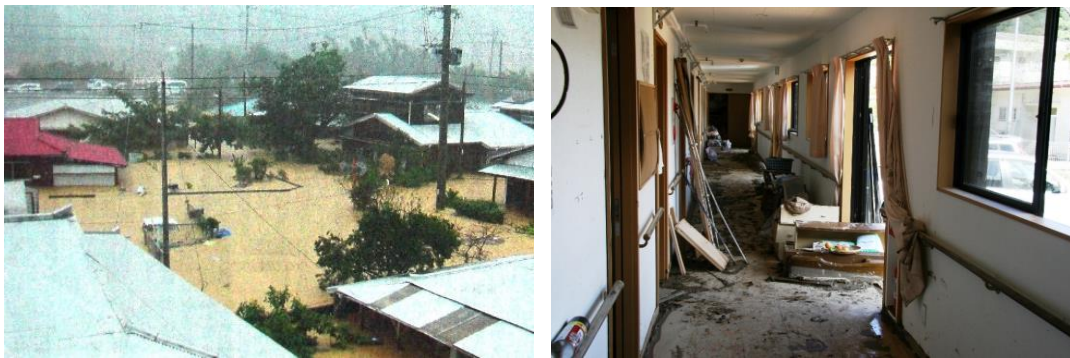
圖 8-2010 年奄美大暴雨災害照片