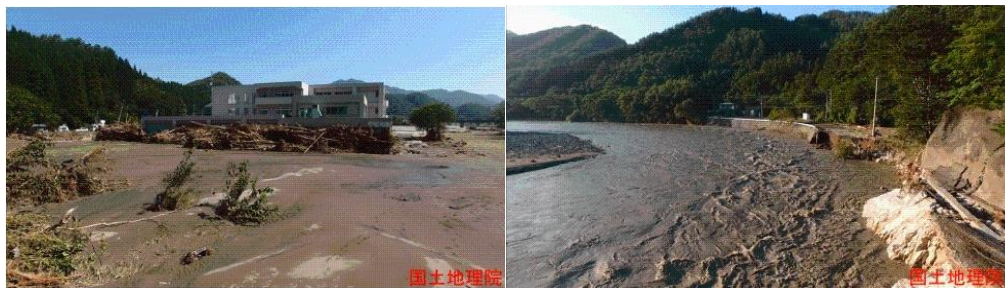
圖 3-第 10 號颱風侵襲岩手縣災害照片

根據日本內閣府針對第 10 號颱風災害處置報告統計:共造成 22 人死亡、5 人失蹤、11 人輕重傷，千餘棟房屋毀損。岩手縣有 20 人死亡，其中 10 人為高齡者，尤其岩泉町乙茂地區高齡養護機構造成 9 人死亡最為嚴重。依據日本消防廳統計:發佈了 1,467 人避難的指示、3.9 萬人的避難勸告，而災情大多集中在北海道與岩手縣。其他災害統計:共發生 160 起土石流，16 起崩塌，多起河川潰堤及河水掏刷、溢淹之災害(圖 3)。其他衝擊影響方面，各地區水電中斷、通訊中斷、道路中斷，鐵路停駛；由於 10 號颱風東北地區登陸，東北和北海道地區共取消 100 個航班。另外，在 311 東日本大震災時損毀的福島第一核電廠，在此次為了避免危險性增加，暫停所有的工作操作。