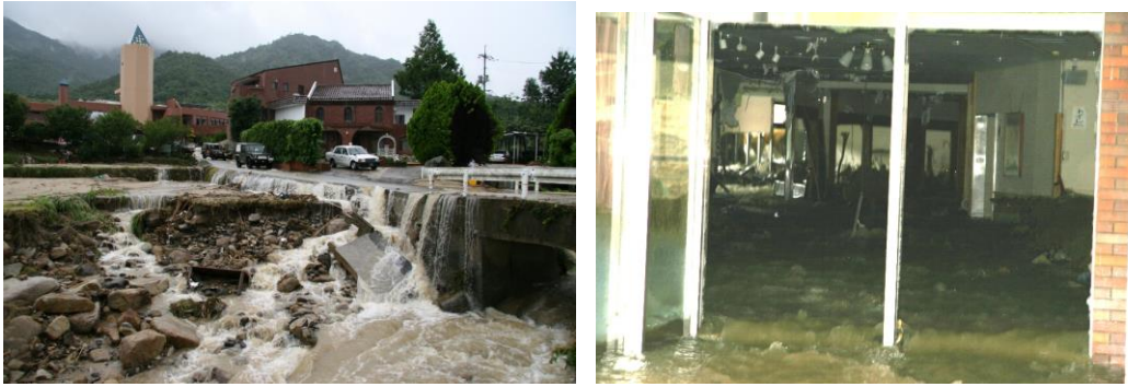
圖 7-2009 年日本中國和九州北部暴雨(山口暴雨)災害照片(日本 防災系統研究所)