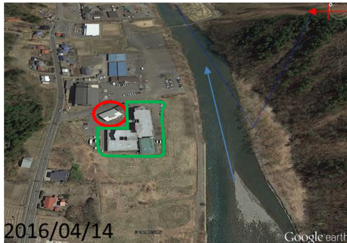
圖 5-岩手縣延泉町空照圖(Google earth)

「樂ん樂ん高齡安養中心」9 人老人喪生(圖 6)引發議題包括:有無發佈避難勸告?或是否延遲發佈、防災演練是否足夠?以及安養機構是否位處安全無虞之處?日本河北新報報導中:自 2000 年至今,當地曾遭遇三次洪災,過去都有順利疏散避難,但此次最後結果是不想預見的慘重死傷。