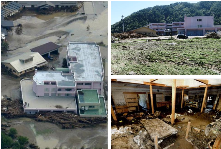
圖 6-樂ん樂ん高齡安養中心受災照片(日本防災系統研究所)

2009 年日本中國和九州北部暴雨(山口暴雨)(圖 7)，使得高砂特別養護老人院(社会福祉法人ライフケア高砂)，在山洪爆發影響下造成 7 人死亡。另外，2010 年奄美大暴雨(圖 8)，鹿兒島縣奄美地區水淹一層樓高，使得養護機構疏散避難不及，造成 2 人死亡。僅管 1999 年廣島縣吳大大規模崩塌災害，造成安養護理機構 32 人死亡，因而傳出相關防制修訂之契機，但機構受災的消息仍然屢見不鮮。